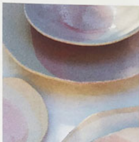
2 Danièle Gerkens