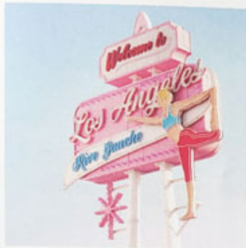
1 Mireille Assémat