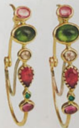
8 Caroline Ignazi