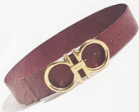
4 Bruna de Margerite