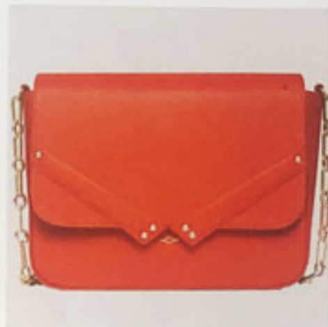
3 Laura Isaac