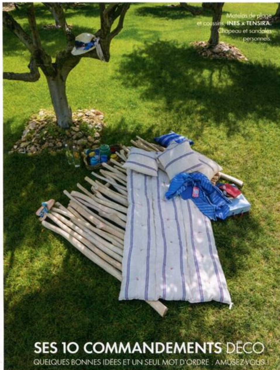
Matelas de plage et coossins, INES x TENSIRA. Chapeau et sandales personnels.