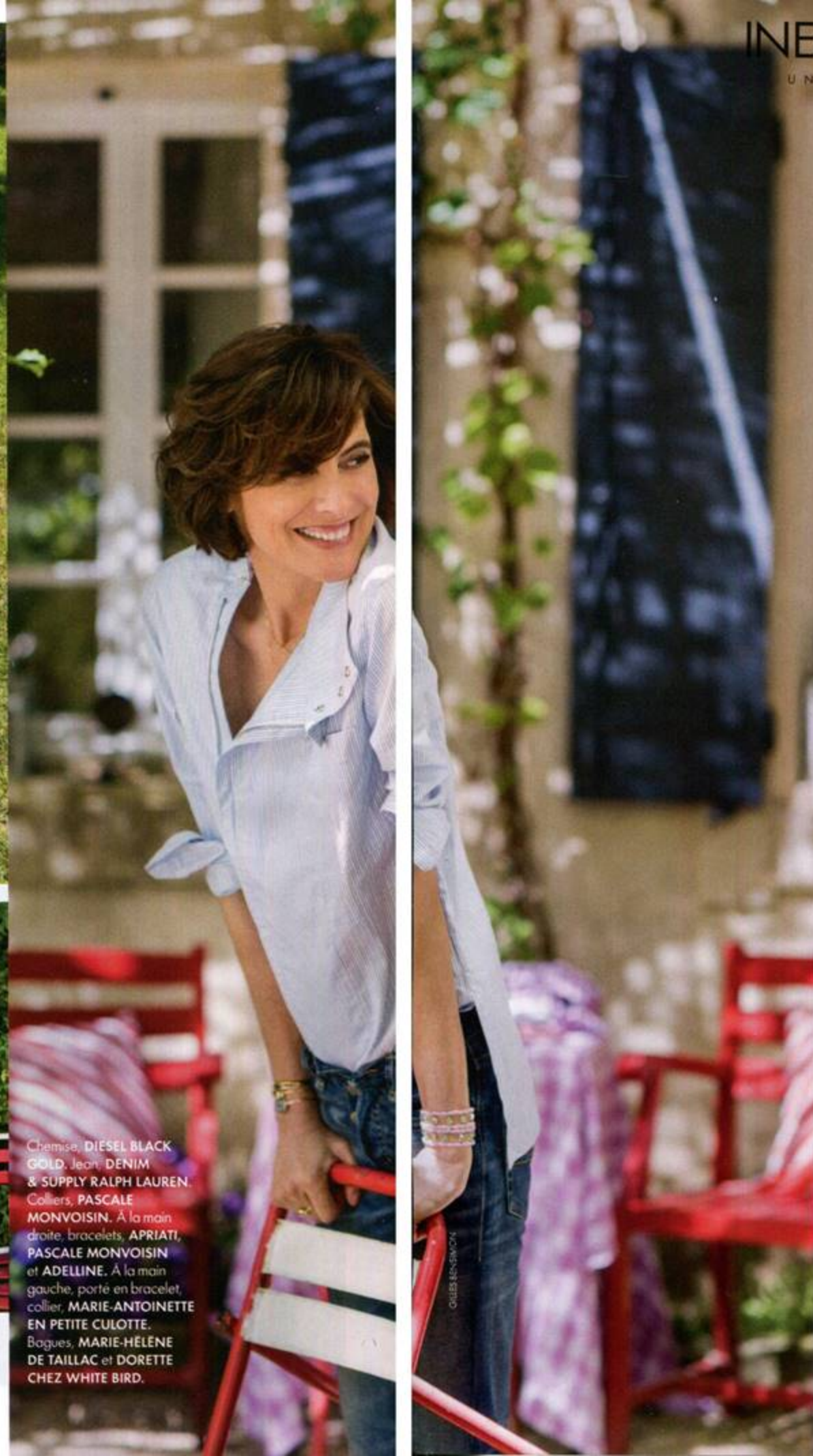
Chemise, DIESEL BLACK GOLD. Jean, DENIM & SUPPLY RALPH LAUREN. Colliers, PASCALE MONVOISIN. À la main droite, bracelets, APRIATI, PASCALE MONVOISIN et ADELLINE. À la main gauche, porté en bracelet, collier, MARIE-ANTOINETTE EN PETITE CULOTTE. Bagues, MARIE-HÉLÈNE DE TAILLAC et DORETTE CHEZ WHITE BIRD.