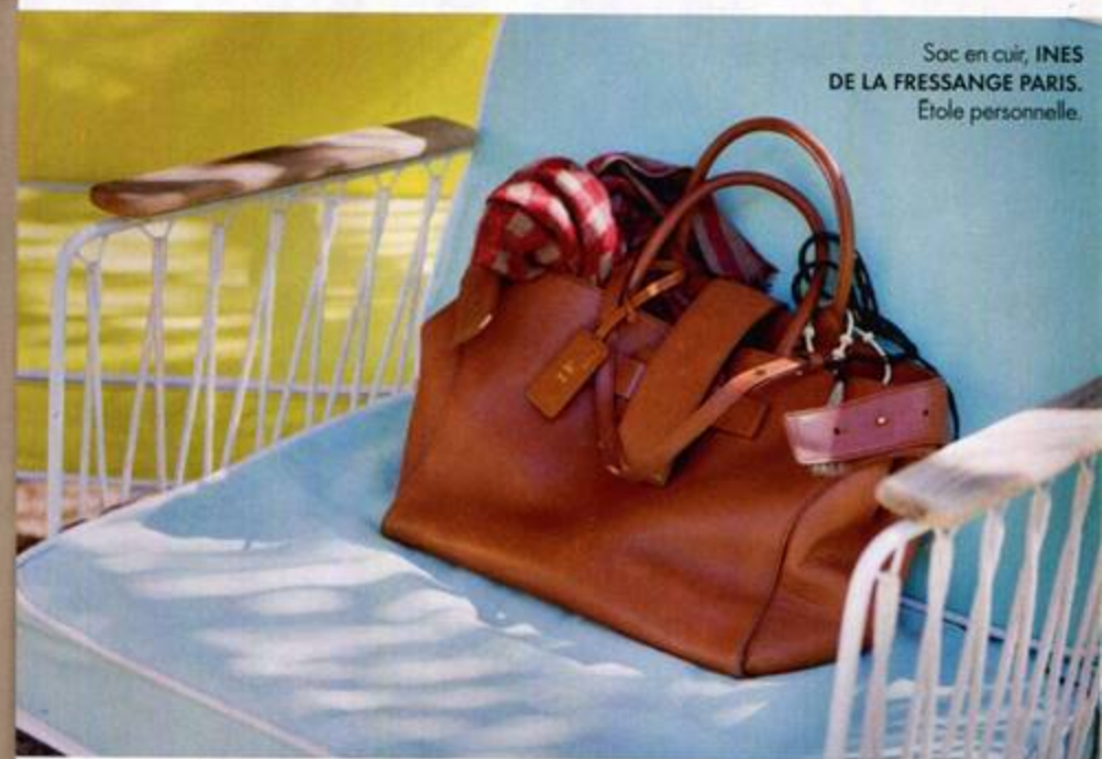
Sac en cuir, INES DE LA FRESSANGE PARIS. Étole personnelle.